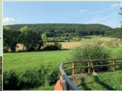
Schöne Aussicht ins Ellertal