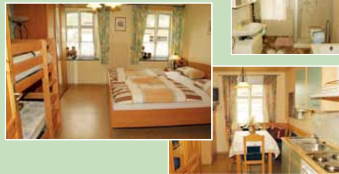
Gartenblick - günstiges Doppelzimmer mit Balkon