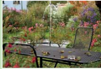
Entspannen am Springbrunnen