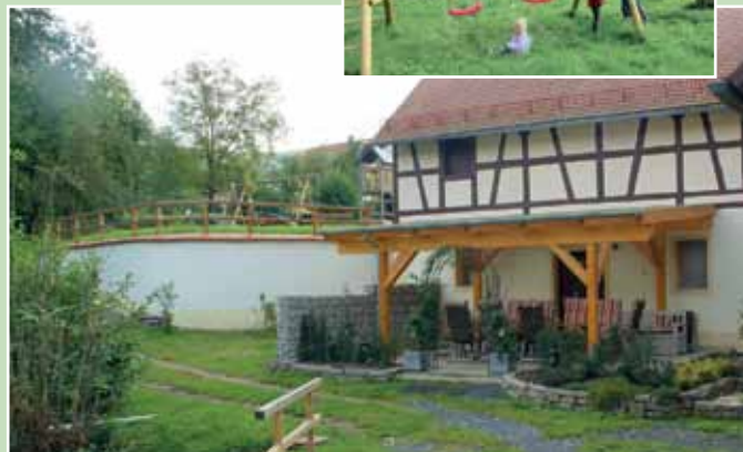
Sonnenterrasse am plätschernden Ellerbach Unten: unser großer geschlossener Innenhof