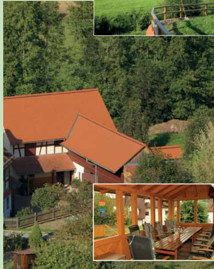
Unten: Sonniger Innenhof und die obere Terrasse