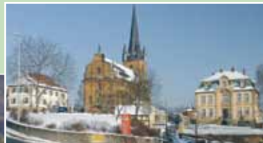
Die Dientzenhofer Kirche in Litzendorf.