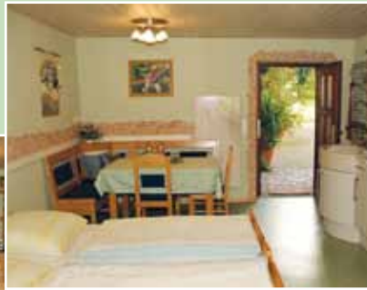
Aufenthaltsraum für große Gästegruppen neben überdachter Terrasse und FeWo Hofstube

In der schönen Landschaft der fränkischen Toskana bieten sich zahlreiche Ausflugsziele und Freizeitmöglichkeiten an. So ist die Weltkulturerbestadt Bamberg in unmittelbarer Nähe. Mit ihren kulturellen Attraktionen wie dem Dom, dem unvergleichlichen Flair der Altstadt, den Bamberger Symphonikern und zahlreichen Museen sowie Sammlungen, ist Bamberg jederzeit einen Besuch wert. Bei uns erhalten alle Gäste ausführliche Broschüren und die kleinen Gäste verschiedene Spieleangebote für einen abwechslungsreichen Aufenthalt.