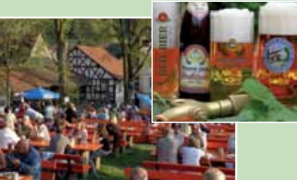
Die schönsten Biergärten mit eigenem Bier und deftigen Brotzeiten gibt es hier - alles zu moderaten Preisen! „Bierwandern“