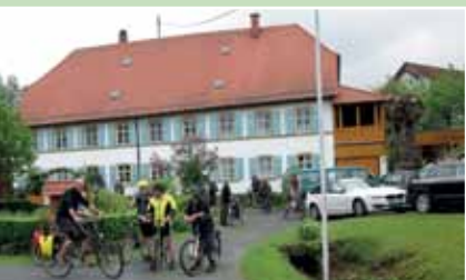
Riesiges Wander- und Radwegenetz, mit einzigartigen Skulpturenwegen